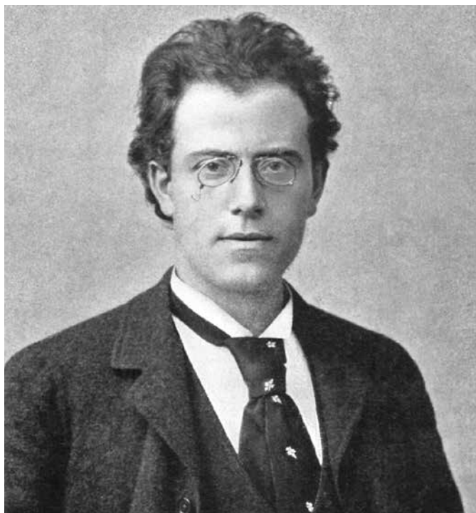
Retrat de Gustav Mahler (1907)

La Novena va ser estrenada el 26 de juny de 1912 (quan ja feia un any que Mahler havia mort).